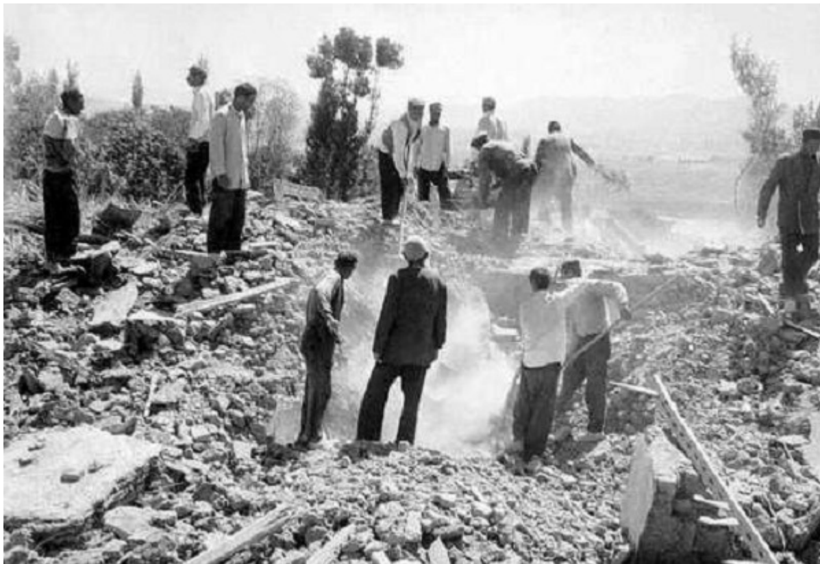
Последствия землетрясения в Казвине, 1962