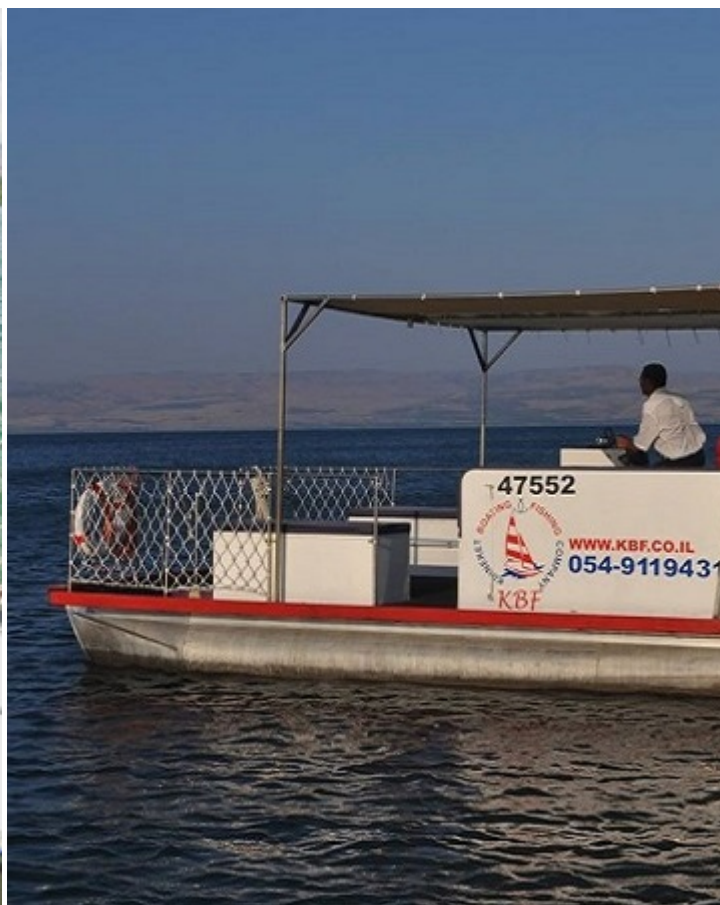
Лодка Аронса на озере Кинерет