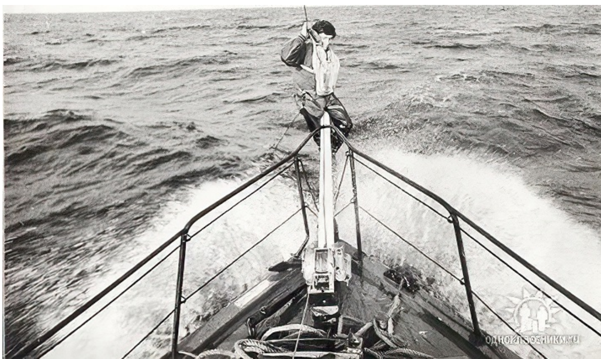
Борис Аронс на борту яхты, Баренцево море