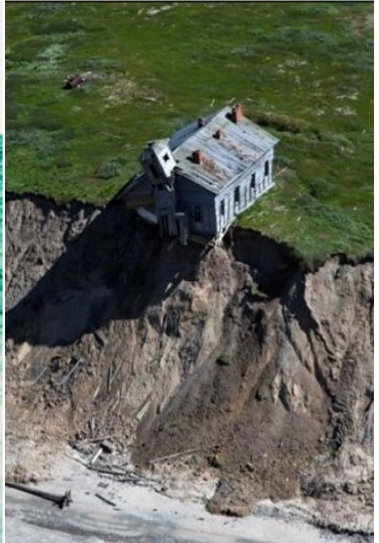
Остров Моржовец.