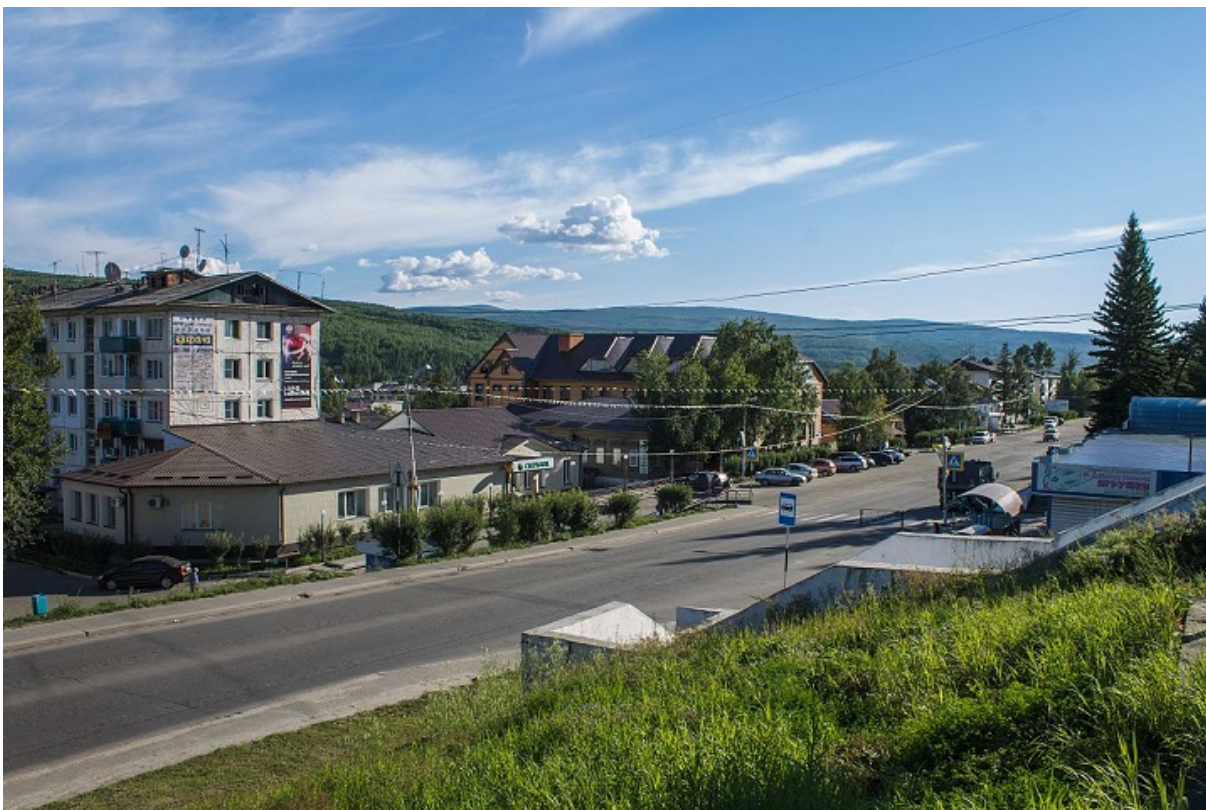
Главная улица Бодайбо